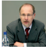
Dr. Axel Reimann, Direktor der Deutschen Rentenversicherung Bund, die ein bedeutender Förderer der Rheuma-Liga ist und die Arthrose-Kampagne unterstützt.

„Wir verzeichnen 60.000 stationäre Leistungen zur medizinischen Rehabilitation bei Arthrose im Jahr. Das entspricht einem Viertel der Rehabilitationen aller Krankheiten des Muskel-Skelett-Systems. 2006 wurden durch die Deutsche Rentenversicherung 8.200 Renten wegen verminderter Erwerbsfähigkeit aufgrund arthrotischer Krankheiten ausgesprochen, das sind 5,2 Prozent aller Erwerbsminderungsrenten.“ |