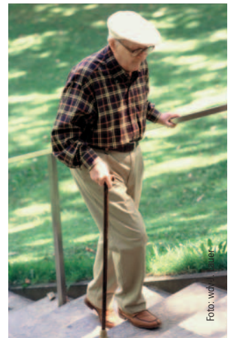
Jeder fünfte Europäer hat Rheuma.

Die Ergebnisse machen deutlich, dass Menschen mit Rheuma mehr Unterstützung und Verständnis brauchen, damit sie am Leben vollständig teilhaben können. Ein Anliegen, das die Rheuma-Liga mit ihren Kampagnen unterstützt. |