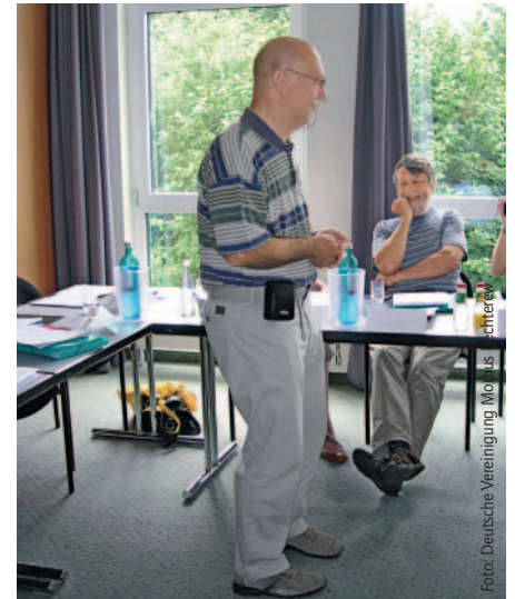
Die Patient Partners verdeutlichen den Ärzten auch die typische Körperhaltung bei Morbus Bechterew.

In einem eigenen Kurs wurden Anfang Juli 16 Patienten mit Spondylitis ankylosans (Morbus Bechterew) ausgebildet. Auch sie werden im Rahmen des Projekts in Ärztefortbildungen ihre Lebens- und Krankheitserfahrungen einbringen und den Ärzten vermitteln, was Patienten mit dieser Erkrankung wünschen. Dazu wurde das Ausbildungsprogramm überarbeitet und ein eigenes Konzept für dieses Krankheitsbild entworfen. Die ersten fünf Termine fanden bereits statt. Der Einsatz geschieht in enger Zusammenarbeit mit der Deutschen Vereinigung Morbus Bechterew. |